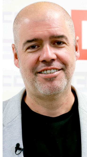
Unai Sordo Secretario General

En el mes de abril, mes en el que se conmemora el Día Mundial de la Seguridad y Salud en el Trabajo, se presentó La LGTBIfobia desde la Prevención de Riesgos Laborales , el documento ya avanza en su título el objetivo que se persigue: acciones, medidas, disposiciones que eviten posibles actos, actitudes o conductas que conforman la LGTBIfobia. Como complemento de éste, se elaboró el documento Actuaciones ante la LGTBIfobia en el ámbito laboral , que representa la parte relativa a las medidas correctoras en el ámbito de la salud laboral.