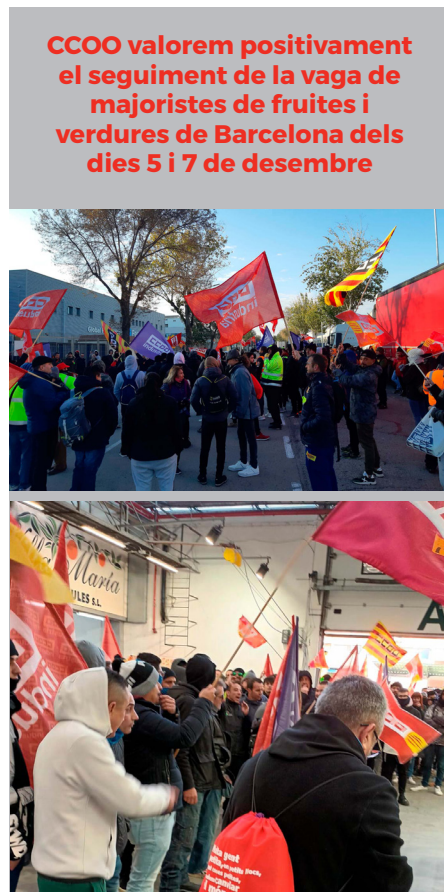
CCOO valorem positivament el seguiment de la vaga de majoristes de fruites i verdures de Barcelona dels dies 5 i 7 de desembre