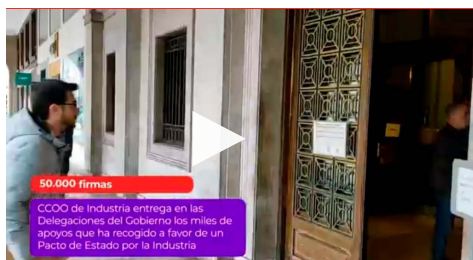
Video de CCOO de Indústria sobre l'entrega de les signatures recollides a tots els territoris per reclamar que es faci efectiu el Pacte d'estat per la indústria de manera immediata, i les diferents accions reivindicatives convocades al conjunt de l'Estat.

Els propers dies convocarem una assemblea per explicar a les persones que treballen al sector quina és la situació actual i quines són les properes accions que es duran a terme.