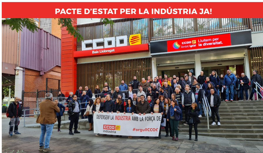
PACTE D'ESTAT PER LA INDÚSTRIA JA!