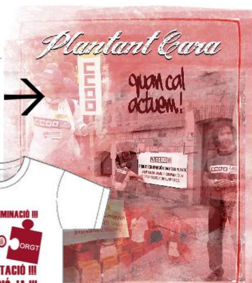
SAMARRETA ELABORADA PER A LA CAMPANYA D'INTEGRACIÓ