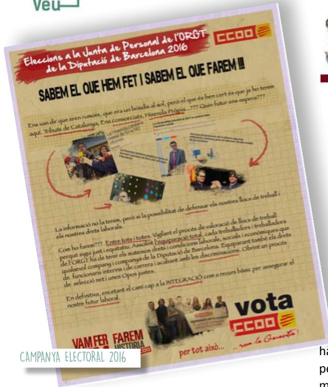
CAMPANYA ELECTORAL 2016