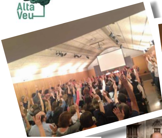
ASSEMBLEES APROVACIO ACORD D'ADHESIO