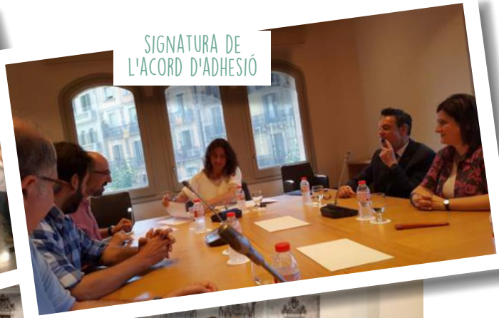
SIGNATURA DE L'ACORD D'ADHESIO