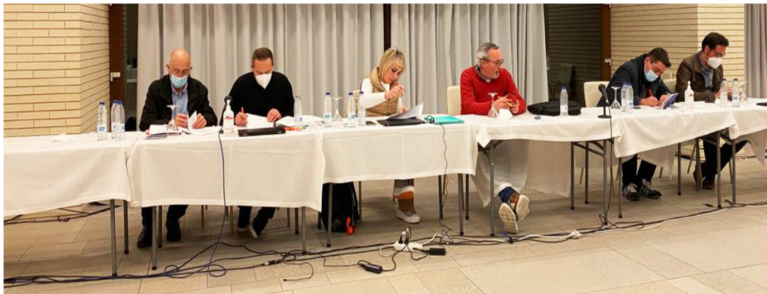
Firma Acuerdo ERE Sección Sindical CCOO Estatal