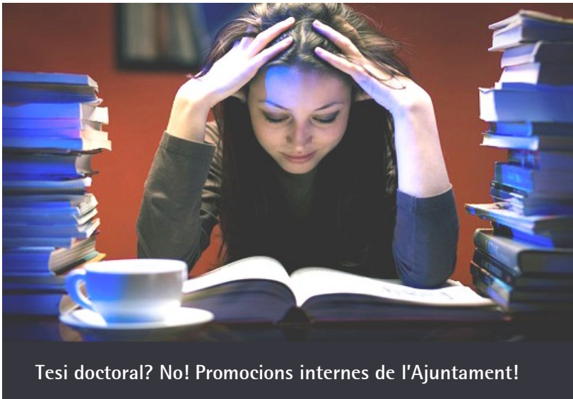
Tesi doctoral? No! Promocions internes de l'Ajuntament!

resposta per part de l'Ajuntament, de moment us animem que prepareu els temes, estudieu les estones que pugueu i ho afronteu amb el màxim optimisme possible, malgrat que l'Ajuntament s'ha obstinat a complicar la vida al personal, innecessàriament. Us continuarem informant i no desistirem en les nostres propostes.